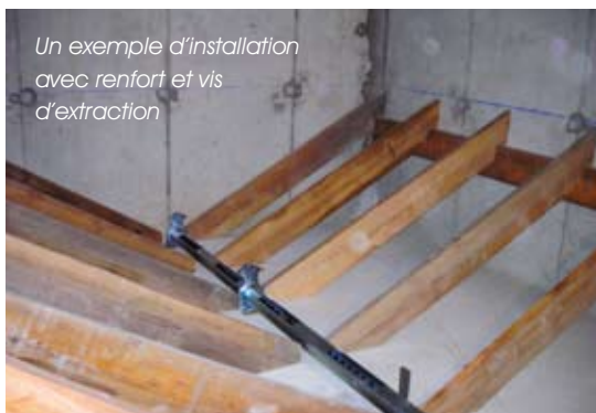
Un exemple d'installation avec renfort et vis d'extraction

Pour un stockage optimisé qui assure sécurité et confort d'utilisation