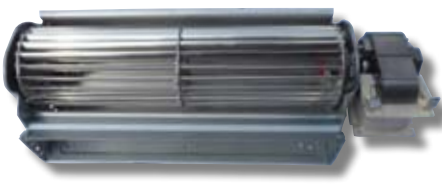
Exemple de ventilateur tangentiel.