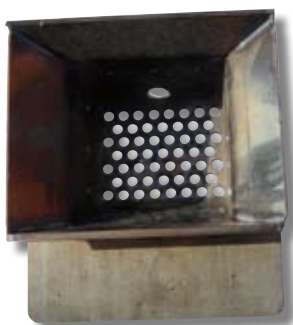
Exemple de creuset.