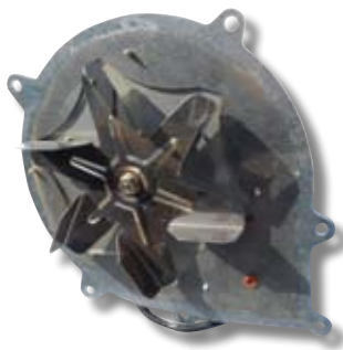
Extracteur de fumée démonté.