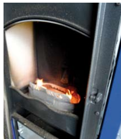
Exemple de foyer.