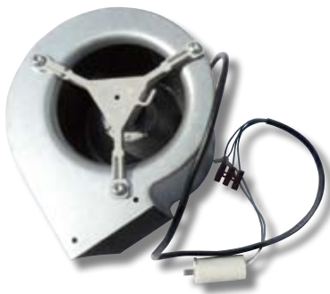
Exemple de ventilateur centrifuge.